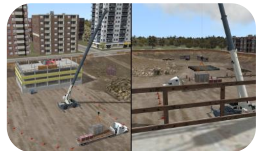
La fenêtre du signaleur