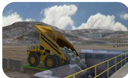
Positionnez le camion et déversez la charge à la position cible