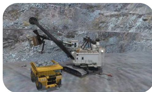
Positionnez le camion pour le chargement par la pelle à câbles