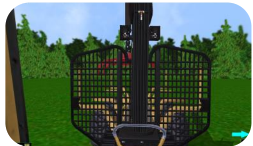
Descarga de troncos para ser depositados en el área meta