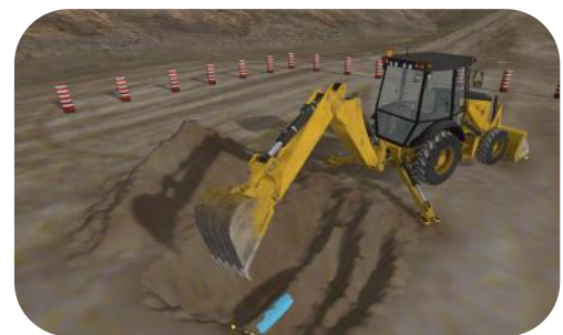
Dégagement de conduite souterraine – Parallèle