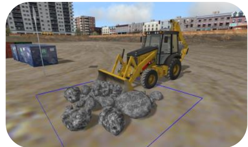
Déplacement du matériel vers une zone de déchargement